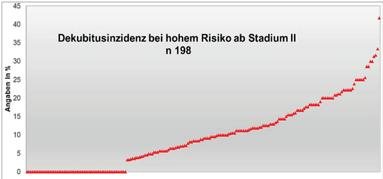
Abbildung 4: Dekubitus ab Stadium II mit hohem Risiko in der Einrichtung entstanden